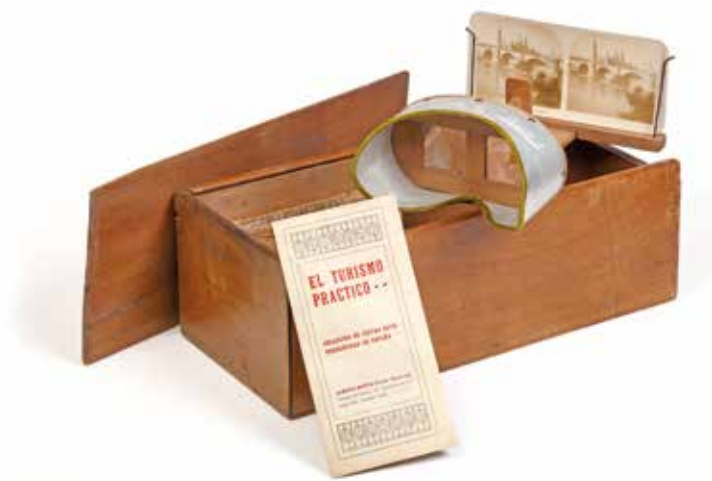
Visor estereoscópico de El Turismo Práctico , Barcelona, ca. 1920. Colección Boisset-Ibáñez.

10:00-10:50 h. PONENCIA: Rachel Bullough Ainscough. CEU San Pablo (Madrid). Fotógrafos británicos del siglo XIX en España y Portugal.