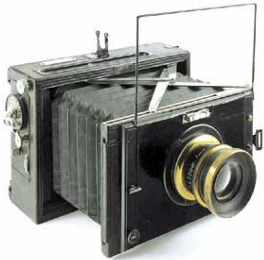
Cámara Contessa-Nettel Deckrullo, Alemania, ca. 1920. Colección Boisset-Ibáñez.