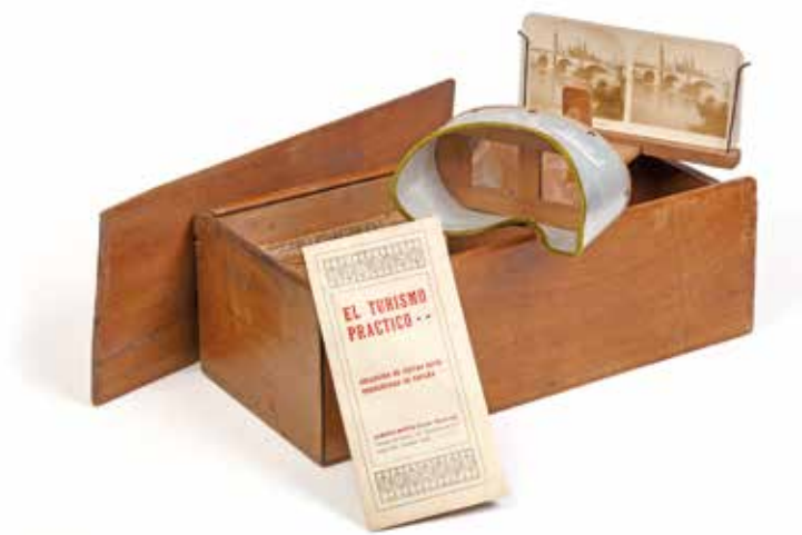
Visor estereoscópico de El Turismo Práctico, Barcelona, ca. 1920.